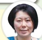
メールセンター 三村

お役に立ててうれしいです!丈夫な骨にはカルシウムの積極的な摂取や、骨に刺激を与える運動が効果的。ウォーキングはオススメです。