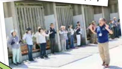
正しい姿勢の歩き方講座も