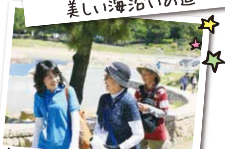
楽しくしゃべりながらウォーキング