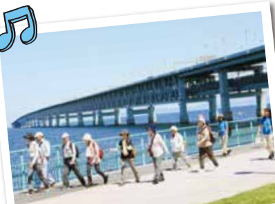
美しい海沿いの道