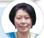
コールセンター 三村

カルシウムは成長期に大切な成分ですが、摂取しても30%しか体に吸収されません。そのため吸収を助けるビタミンなどと一緒に摂るのが良いと言われているんですよ。