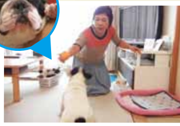
◀元気がっぱいのテンちゃんとおボール遊びを楽しめるのもふしぎ好調のおかげ！