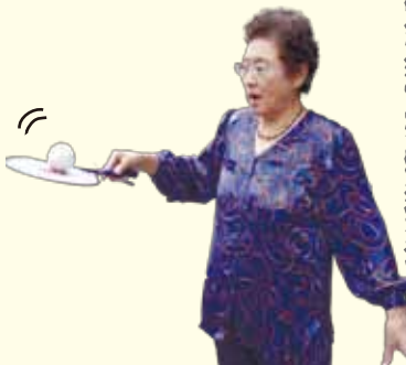
▲太極拳と球技を融合した「太極柔力球」の腕前もご披露

僕は体が硬くてぜんぜん曲がらないです。何かをずっと続けていらっしやるというのには本当に素晴らしいことですね！