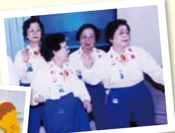
◀毎月お届けしている絵手紙をお部屋に飾ってくださっていました