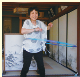
華やかなフラフープもご披露くださいました!

西口 とても多彩なご趣味をお持ちですね!! これからもワダカルのカルシウムと共に活動的な毎日をお過ごしください。