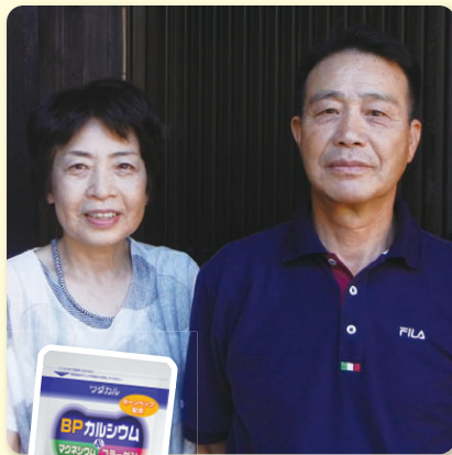
とても仲のよい辰巳様ご夫婦

ワダカルでは、直接お客様と会ってお話を伺ったり、お客様との交流の場「歩こう会」を開催し、歩く幸せを共に感じています。この「お声ひろば」では、インタビュアーさせて頂いたお客様との話や、お寄せ頂くお便りをご紹介し、より多くの方にイキイキと過ごして頂きたいと考えています。