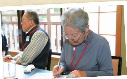
真剣なまなざしのお客様

毎回大好評の健康セミナー。「骨粗鬆症を予防するには?」「カルシウムと一緒に摂ると良い成分は?」などなど、気になる骨の健康について、わかりやすくご紹介。骨とふしぶしの健康を気づかう皆さまから、「へえ〜」なるほど」と納得の声が聞こえました。