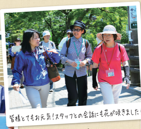
皆様とてもお元気!スタッフとの会話にも花が咲きました!