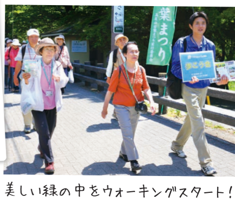
美しい緑の中をウォーキングスタート!