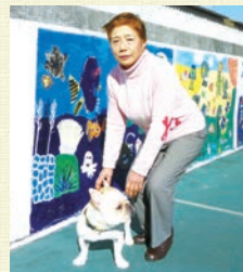
天気の良い日は愛犬のゴンちゃんとお散歩。3時間歩くこともあるんだとか！

でも今は週二回レッスンに通って、土日は主人と一緒にコースを回ることもありますよ。