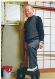
軽快な動きは日々のトレーニングの賜物