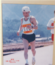
ロードレース大会に出場力強さが伝わってきます

充実感や、何が起こしても怖くないという自信が湧いてきます。今の目標は、85歳まで5〜10キロ走れる体力を維持すること。ワダカルさん、これからも飲み続けますよ！