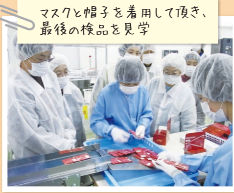
マスクと帽子を着用して頂き、最後の検品を見学