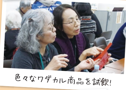
色々なワダカル商品を試飲!