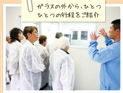
ガラスの外から、ひとつひとつの行程をご紹介します