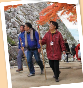
急な石段も何のその!

約40年前に建てられた彦根城は、国宝に指定されている天守や美しい庭園など、見どころがたつぷり。お客様、スタッフでおしゃべりを楽しみながら散策しました。