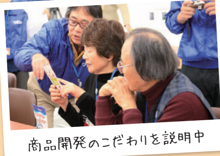
商品開発のこだわりを説明中