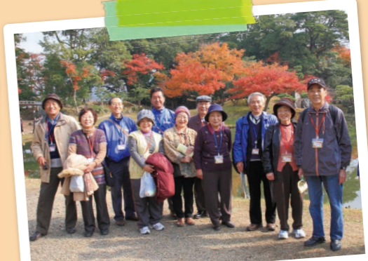
庭園では紅葉が真の盛り!