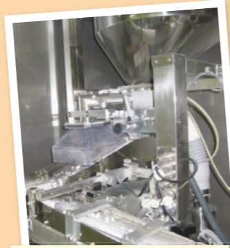
できあがった粒は機械と人の目で厳しいチェックを受けます