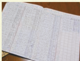
ノートにはご夫婦の健康記録がビッシリ！

いるんですが、数値が良くなってきているのが分かるんですよ。先生にも驚かれました。 西口 それは何よりです！1日3袋を3ヶ月続けて頂くことでコレステロール値の低下が期待できますので、ぜひお続けください。それにしてもとてもきっちり健康管理なさっているんですね！