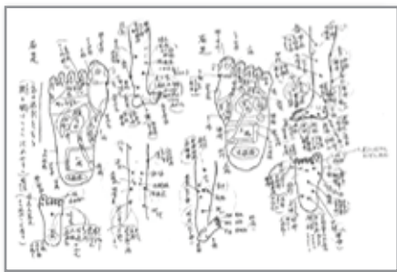
▲手作りのツボ図解。この精巧さはスゴイの一言。

普段の食事で補えない ヒアルロン酸 やコラーゲンの 入った「四季潤」は心強いですね。 おかげで旅行も大好き! 体の内側から元気になるために、 ツボ押しや呼吸法も勉強しています。