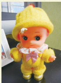
土居様手編みの服がとってもキュート♪