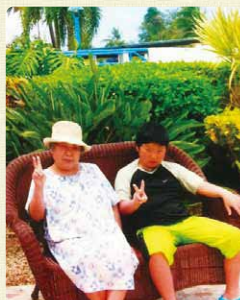
お孫様と海外旅行に行かれるほど活動的です！

今までの「お声ひろば」をご覧になりたい方は こちら ▶ わいわいお声ひろば 検索