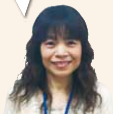
コールセンター 大山

サプリメントの飲み 合わせは、お一人 おひとりに合わせて お応えしますので、 お気軽にお電話 ください！