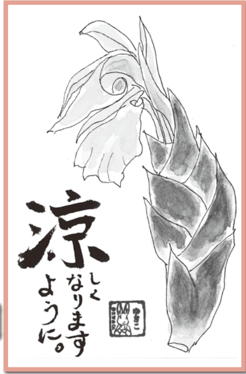
滝澤由紀子様(千葉県/72歳) ワダカル商品ご愛飲歴 6年8ヶ月