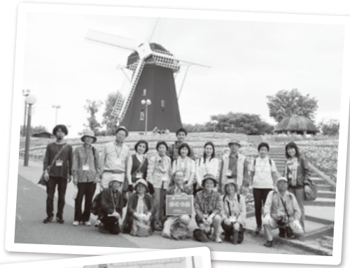
大阪・鶴見緑地で開催された第14回歩くこう会

そんな想いで生まれたお客様との交流イベント「歩くこう会」もいよいよ15回目を迎えます。 今回は、地元大阪を飛び出し東京へ! 関東の皆様にお会いできるのを楽しみにしております。