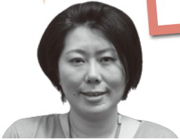
コールセンター 三村

たくさんの川柳のご応募ありがとうございます！ ございました！私も皆様の様に 芸術の秋を楽しみたいと思います。