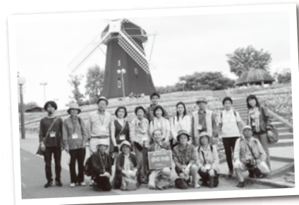
▲第14回 歩こう会開催地 「花博記念公園鶴見緑地」