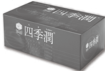
▲新パッケージの『四季潤』