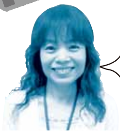
コールセンター 大山

唱和の後は 通信販売部スタッフが お客様のお声を発表！ うれしいお声だけでなく、お叱りのお声も 共有し、サービス改善へと繋げています！