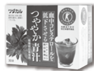
つややか青汁 〈顆粒〉