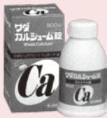
ワダカル シウム錠 (1994年)