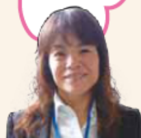
コールセンター 大山