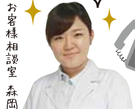
お客様相談室 森岡