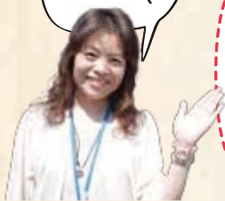
コールセンター 大山

毎日歩いた歩数、また、趣味やイベントの予定を記入するなど、自由にお使いください！