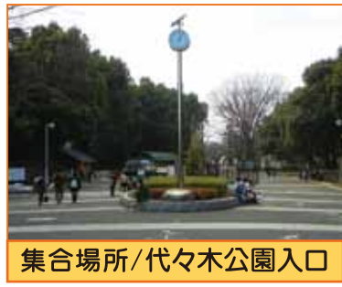
集合場所/代々木公園入口