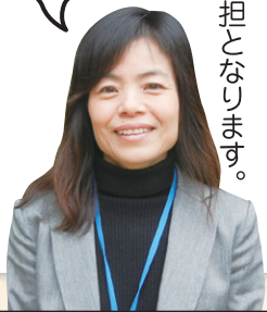
コールセンター 大山