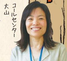
大山 コールセンター