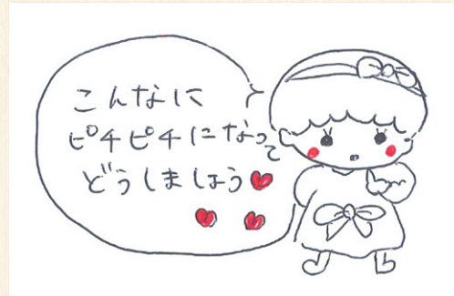
BPPカルシウム& マグネシウムコーゲン他 ご愛飲歴7年4ヶ月 兵庫県神戸市 成田 悦子様