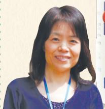
コールセンター 大山