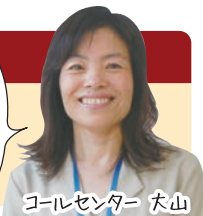
コールセンター 犬山