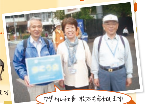
ワダカル社長 松本も参加します!