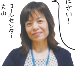
コールセンター 大山