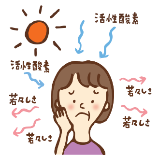
年齢とともに失われる若々しさを応援!