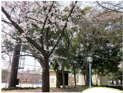
スタッフ西口の散歩道