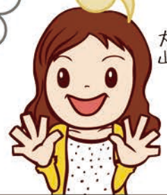
コールセンター 大山

いつもワダカル新聞読んでます。 歩こう会、楽しそうですね。 ぜひ一度参加したいのですが、 いつも大阪なのでなかなか…。 関東でも開催してくれませんか？