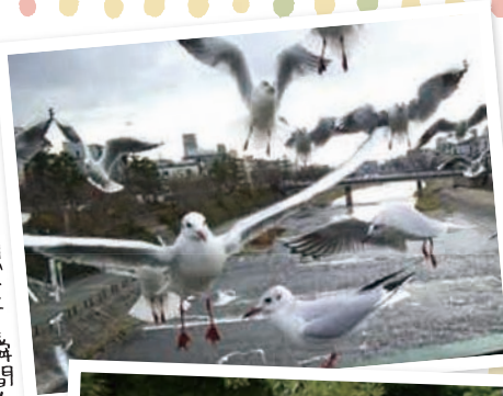
鳥が一斉に羽ばたく瞬間!