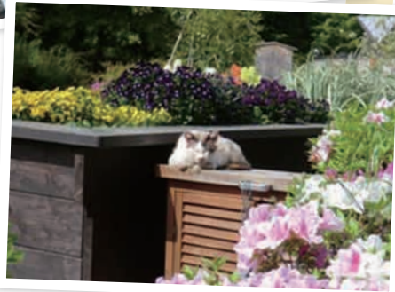
気持ち良さそうだな