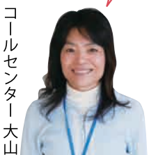
コールセンター 大山

皆様と共に歩んで100余年。これからも永く愛される商品づくりにはげんでまいります！