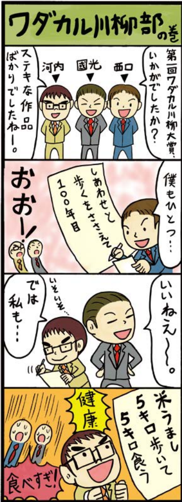
コルセンター 大山

年齢を重ねると、栄養を吸収する力も落ちていきます。健康食品で効率的に補ってくださいね。