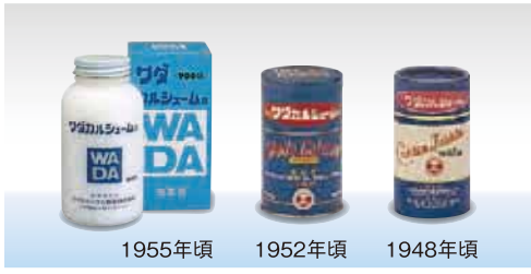
ワダカルシウム錠のデザイン