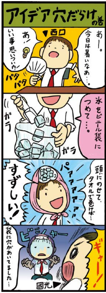
クールセンター 大山