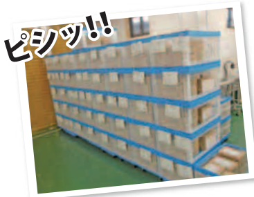
きれいに整理整頓された道具や 荷物は、作業効率を大きく高めます