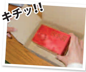
一つひとつ心を込めて、 丁寧に梱包しています