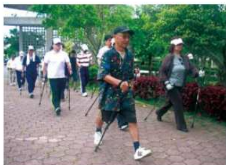
腕の運動にもなり、エネルギー消費量アップ！